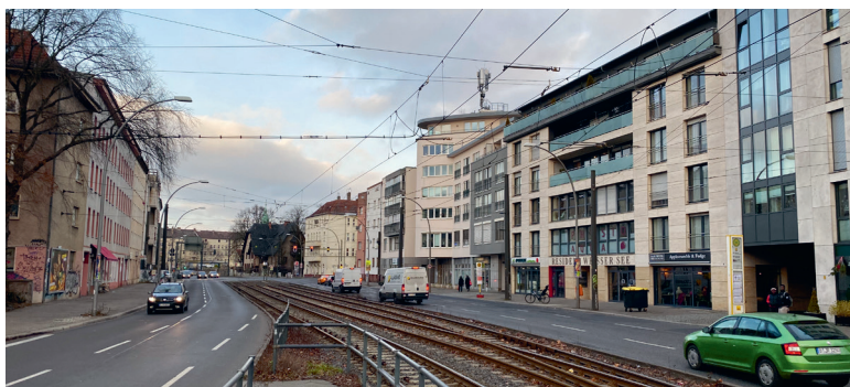
Die Berliner Allee in Weißensee heute.

Kommen Sie gerne spontan vorbei! Falls Sie sich anmelden wollen: beratung.gruene-pankow@gmx.de