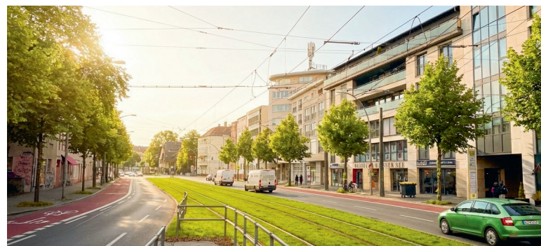
Die Berliner Allee wie sie in Zukunft aussehen könnte.